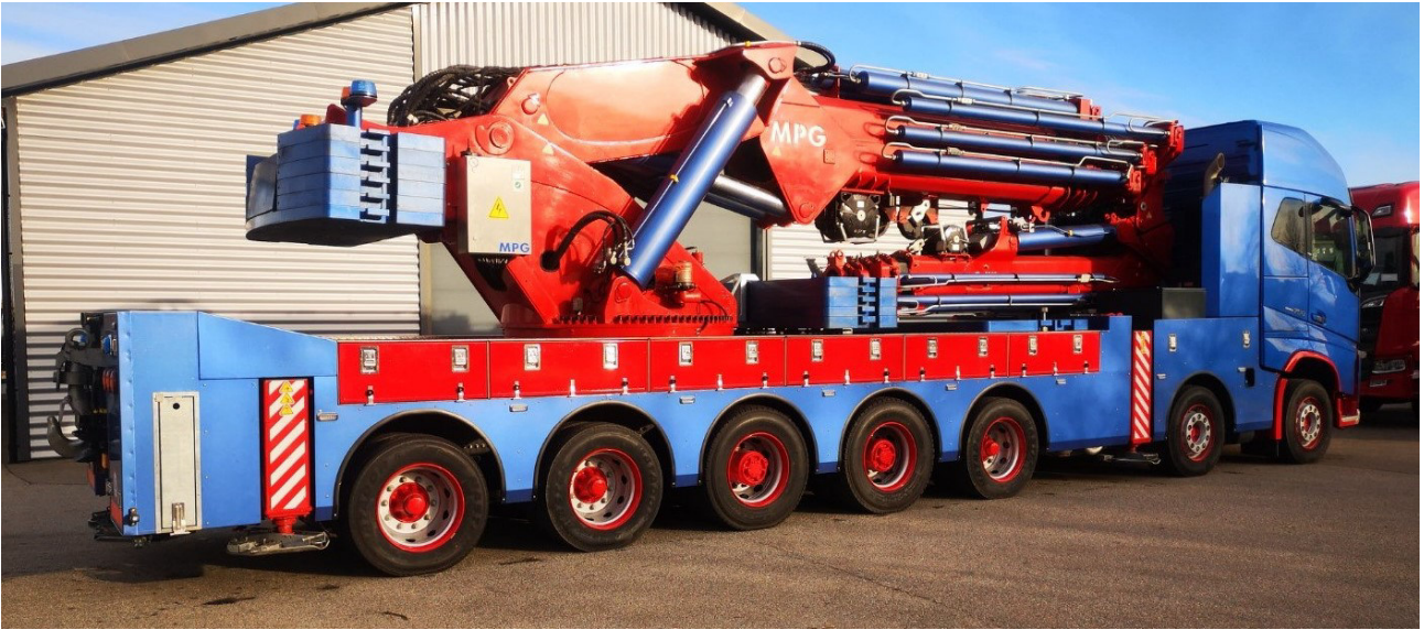
The first 7-axle Volvo FH 750 14x4*10 mounted knuckle-boom crane MPG 450L9-L6 Der erste 7-achsige Volvo FH 750 14x4*10 Aufbau Knickarmkran MPG 450L9-L6/