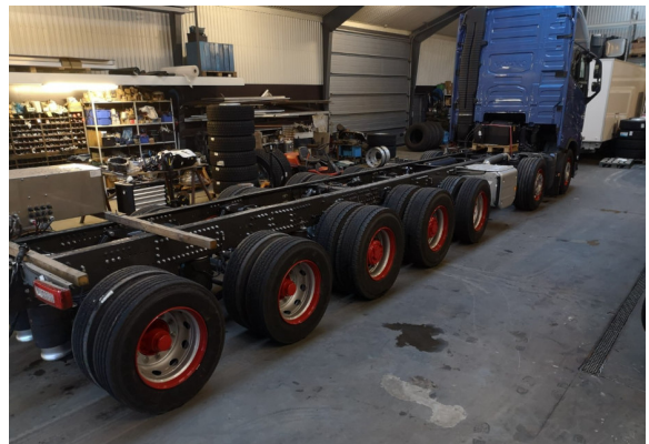
Volvo FH 750 14x4*10 back view/ Heckansicht