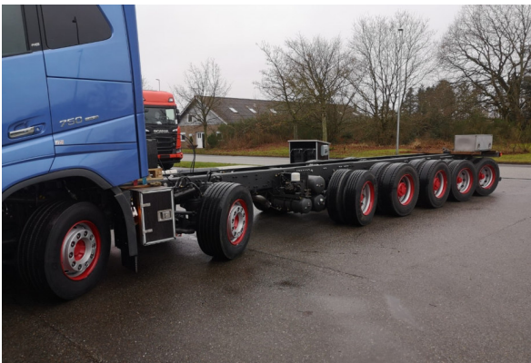
maximum steered / kompletter Lenkeinschlag