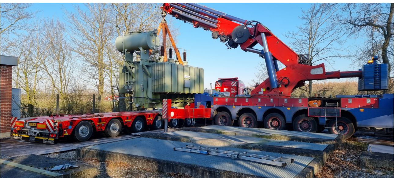
MPG 450 L9 lifts a 53t heavy transformer / MPG 450 L9 hebt einen 53t schweren Transformator